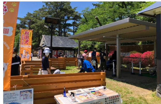
【秋田犬ふれあい処 in 千秋公園の様子】